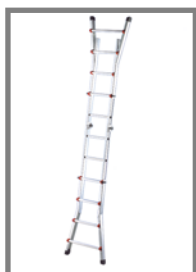
Escalísima en apoya

Abierta puede trabajar en apoyo, tijera o en desnivel. Cerrada es muy compacta y se puede transportar fácilmente incluso en maleteros