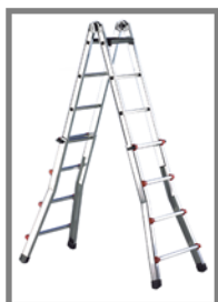
Escalísima en tijera

OBLIGATORIO el uso del estabilizador en posición de apoyo a partir de 3 m de altura